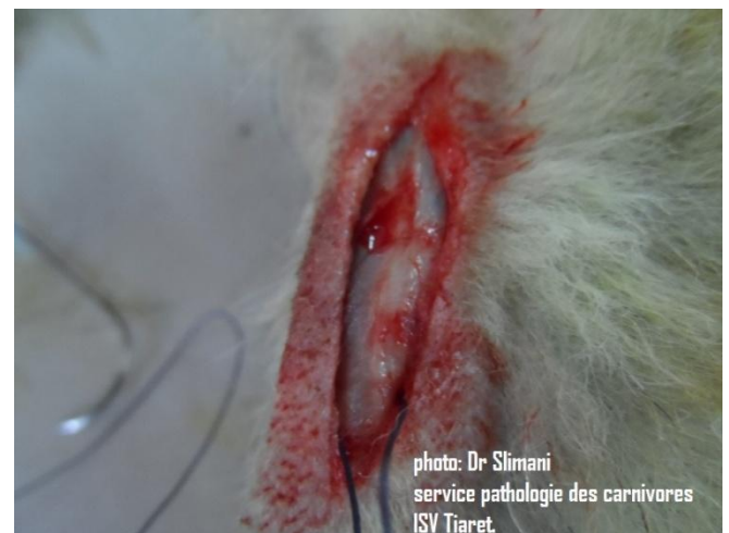
5: veine radiale vue de proche.