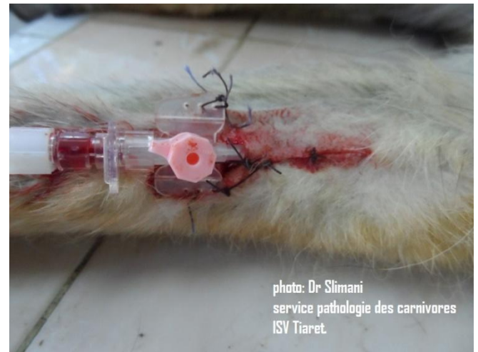
9: suture de la peau incisée par des points simples séparés.