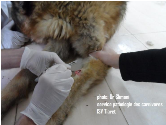
1 : incision cutanée de 2 cm de long après rasage de la face externe de la zone radiale (veine céphalique).

Auteur : Dr Slimani khaled (chargé du module pathologies des carnivores), en collaboration avec l'équipe clinique : Dr Hariche Zahira, Dr Benssgheieur Fatiha, Dr Kaddari Amina.