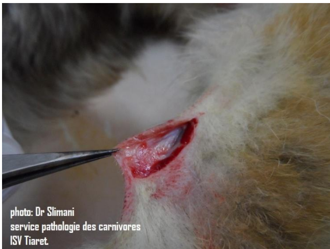
2 : mise en évidence de la veine radiale.