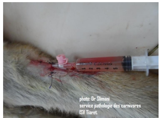
10 : l'aiguille est retiré du cathéter et une seringue remplie de sérum salé est placée afin d'assuré la vacuité du cathéter.