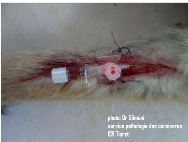
8: fixation du cathéter avec la peau par points simples,