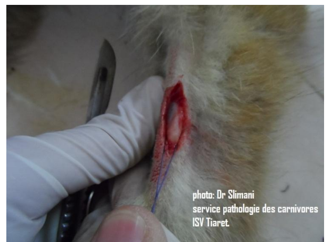
4 : fixation et extériorisation de la veine radiale.