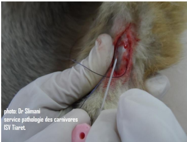
6 : insertion d'un cathéter muni d'une aiguille dans la veine.