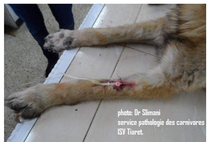
11 : mise en place d'une perfusion.