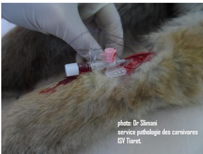
7: cathéter complètement introduit dans la veine,